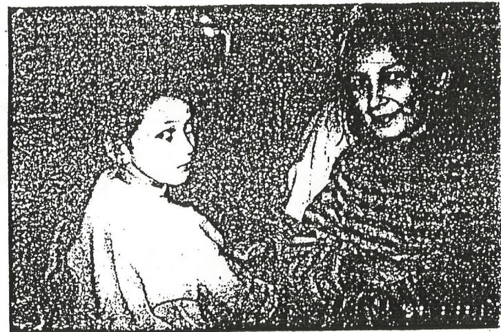
W klubie komputerowym

z Ośrodka mogą korzystać też przyjezdni goście. Udostępnia się im telewizję, wideo, a zorganizowane grupy mogą liczyć na tani nocleg. Z pracy klubu korzysta jednorazowo 10 - 50 osób w różnym wieku. Tak szeroki zakres działań możliwy jest dzięki zrozumieniu i pomocy ze strony samorządu gminnego.