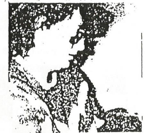
Anna Świądek chętnie wprowadza w arkana gry na instrumentach