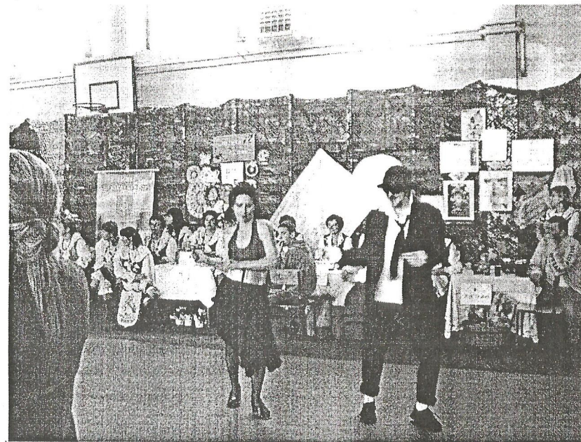
Ta sama para tańczy twista

Koło Gospodyń z Karszanka otrzymało dyplom i puchar ufundowany przez organizatorów oraz czek gotówkowy ufundowany przez Wójta Gminy Osiek .