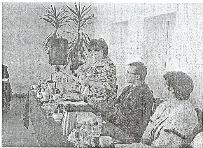
Pani Wójt przedstawia obecnym na posiedzeniu Rady Gminy dokonania minionego roku.