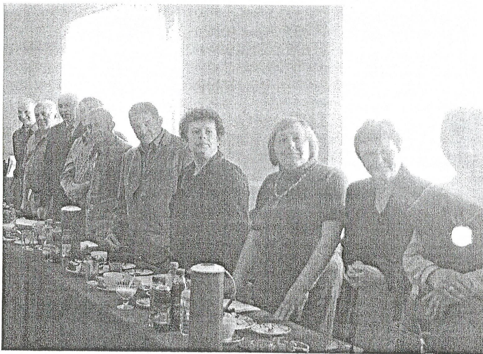
Radni po udzieleniu absolutorium Wójtowi Gminy.