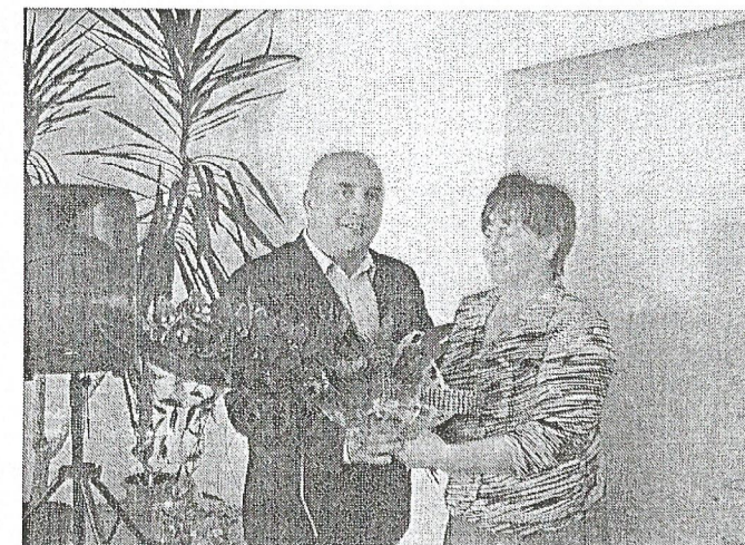
Przewodniczący Rady Gminy gratuluje Pani Wójt uzyskania absolutorium.