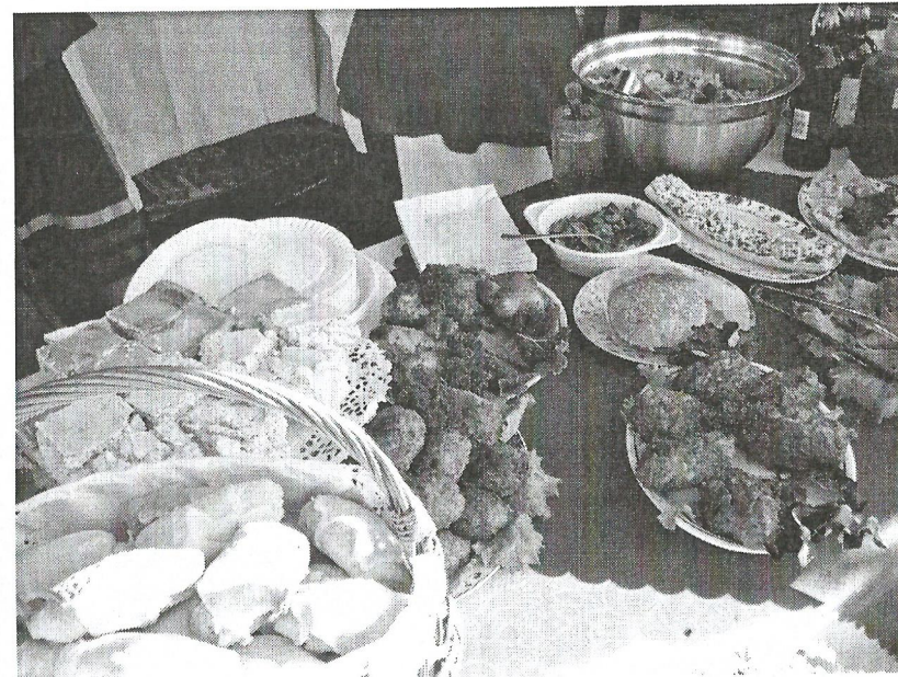
Pyszne jadlo KGW. Smakowaliśmy.