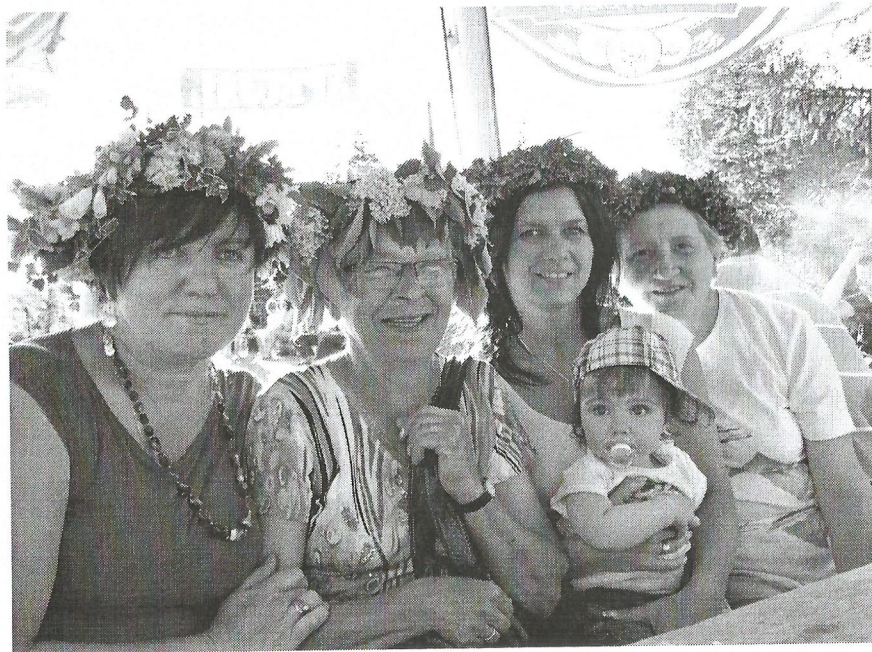
Nasze, swojskie MISS.. ki. Ślicznie wyglądały, a szczególnie.. najmłodsza. Szkoda, że bez wianka.