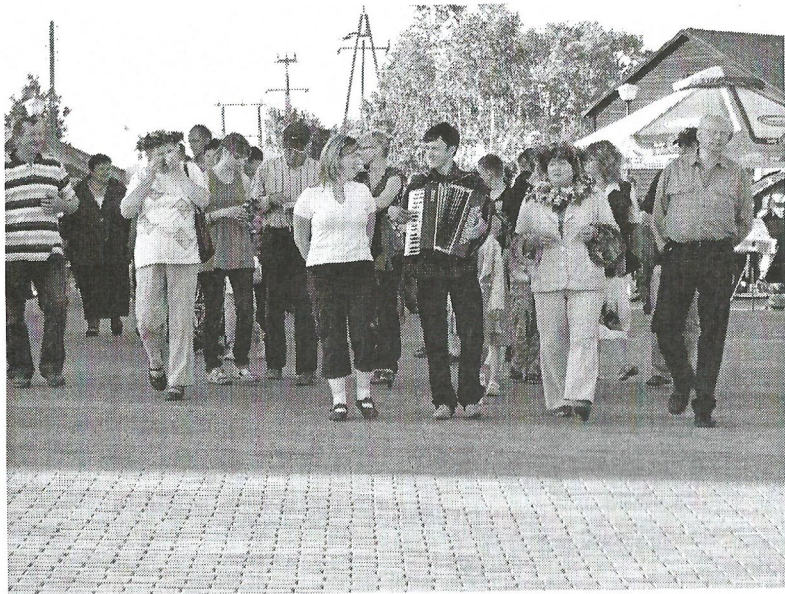
Spacer z wiankami nad jezioro