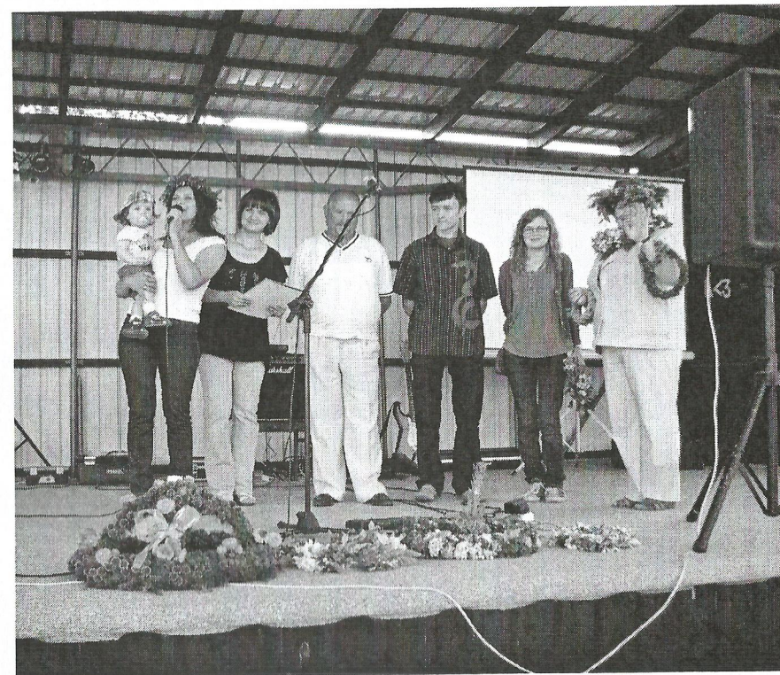
Jury konkursu (na scenie) za najpiękniejszy wianek uznało wianek z Karszanka (trzeci od lewej). Pierwszy równie piękny, prawda? Jest on z Lisówka. Gratulujemy wszystkim.

Dziękujemy wszystkim za wspaniałą zabawę, a Was - Drodzy Państwo, zapraszamy na kolejną imprezę, która odbędzie się już niedługo, bo 17 lipca „NA JAGODY” .