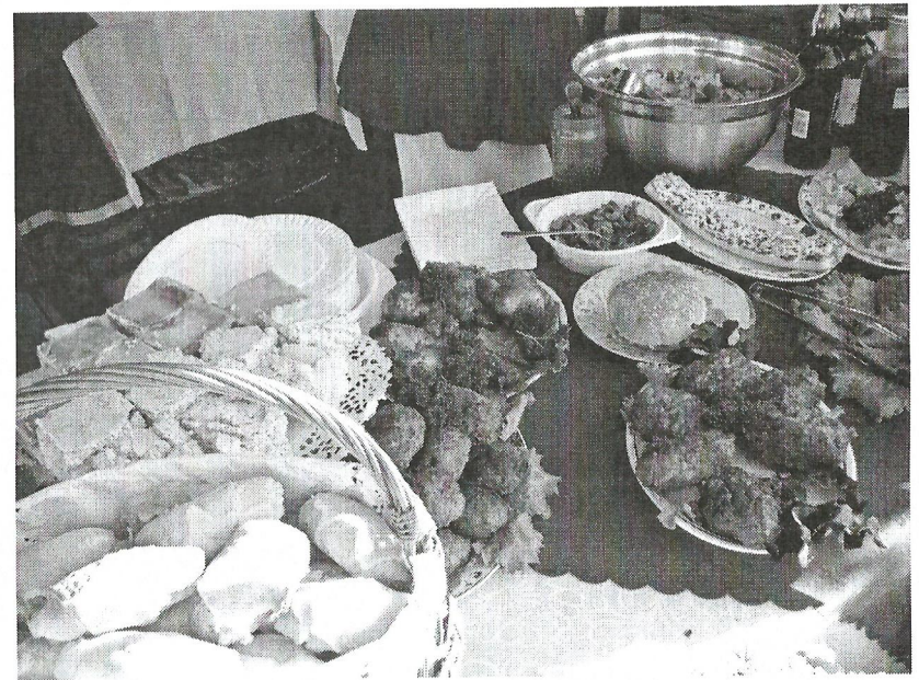
Pyszne jadlo KGW. Smakowaliśmy.