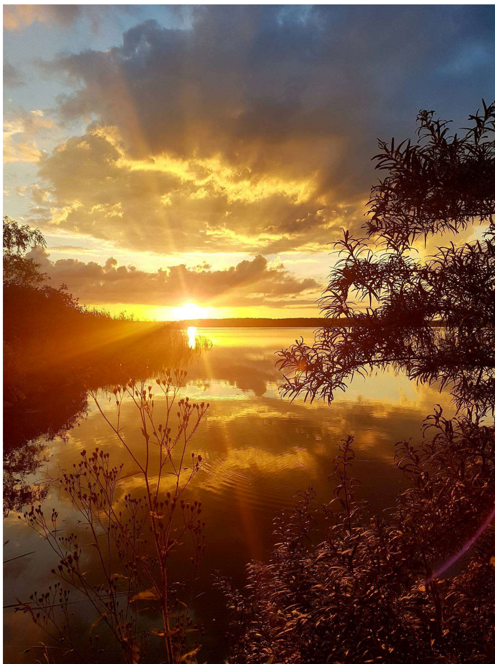
Zachód słońca nad Kałębkiem