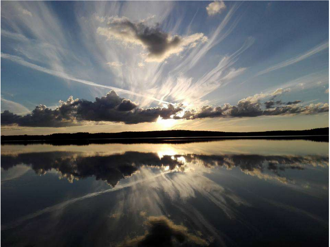
Wędkarze mają wrażliwą duszę....