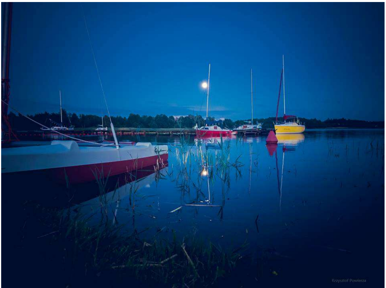
Piękne wieczory