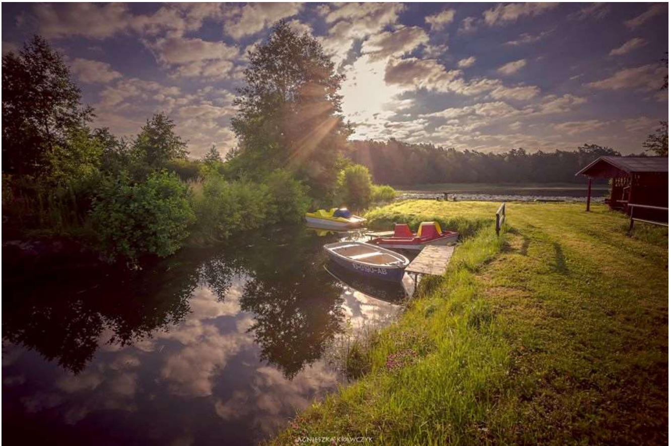
Piękne poranki